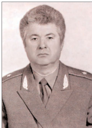
Voronin în uniformă de general de miliție sovietic

„Lavrov - catalizatorul scandalului dintre Chișinău și București“ - titra cotidianul de la Moscova Nezavisimaa Gazeta în ediția sa din 16 martie afirmând că: „Serghei Lavrov a luat apărarea Moldovei la UE și astfel a declanșat un scandal între Chișinău și București“. „Relațiile dintre Republica Moldova și vecina ei cea mai apropiată România s-au deteriorat în asemenea grad în ultimul timp încât următoarea treaptă a evoluției acestora ar putea să fie doar ruperea relațiilor diplomatice între cele două țări“, apreciază publicația rusă, indicând că drept motiv pentru escaladarea tensiunilor în relațiile dintre „cele două state frățești au